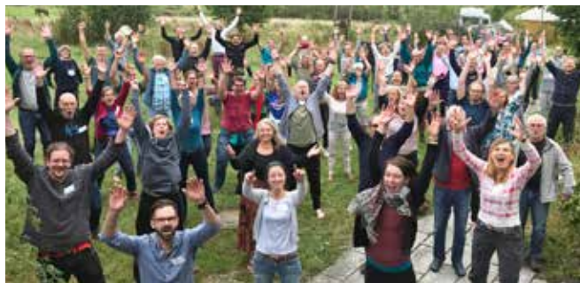
GWÖ Sommerwoche – das jährliche Treffen aller Aktiven